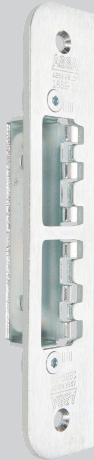
Säkerhetslutbleck Modul 1889-11/1889-12